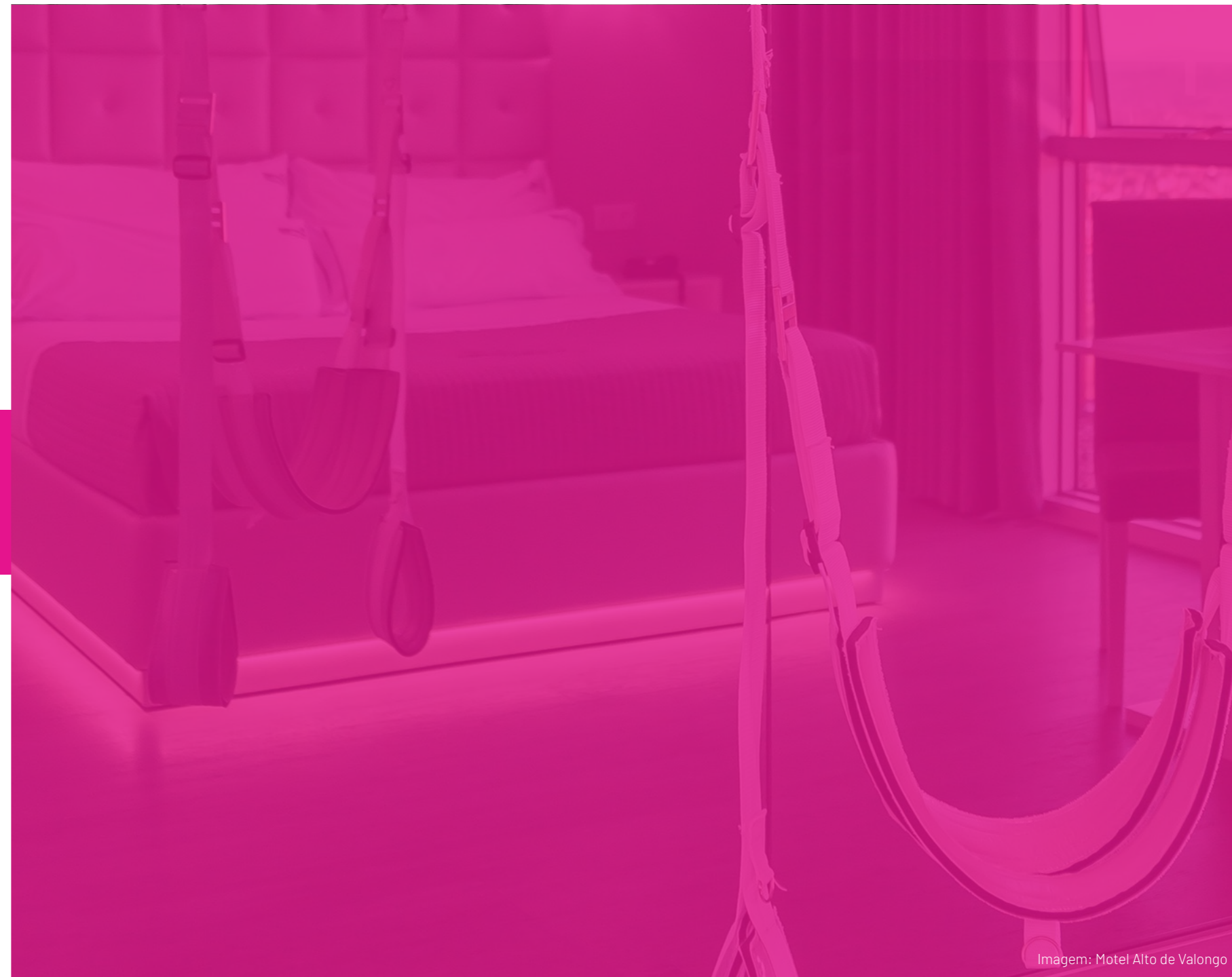
Imagem: Motel Alto de Valongo

Os Motéis são lugares envoltos em mistério e fascínio, que há muito tempo têm uma conexão intrínseca com a sexualidade humana. Neste e-book, iremos desvendar os segredos dos motéis e analisar como eles desempenham um papel fundamental na expressão da intimidade e do prazer.