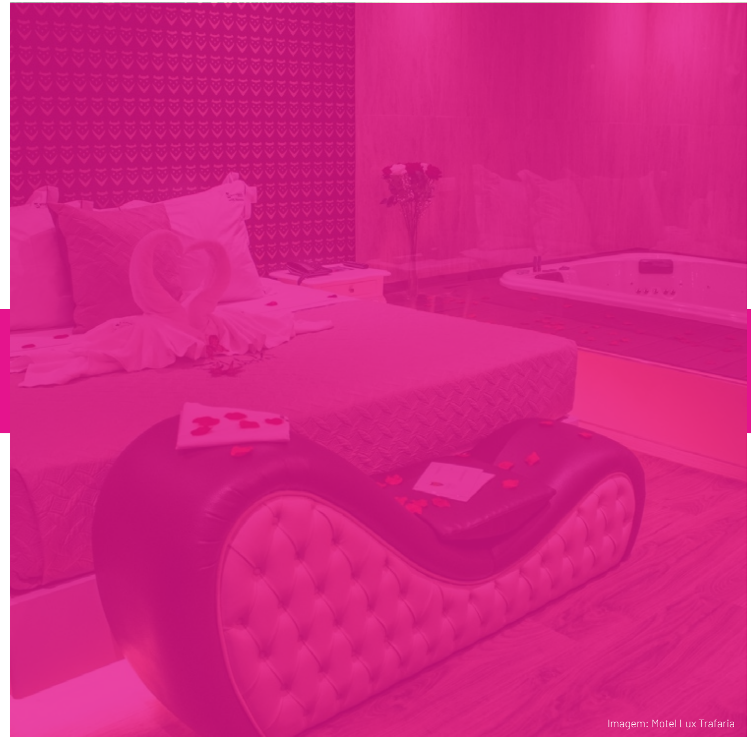
Imagem: Motel Lux Trafaria

Para alguns indivíduos, uma estadia num Motel oferece uma oportunidade de se reconectar com a sua própria sexualidade e descobrir o que realmente os excita.