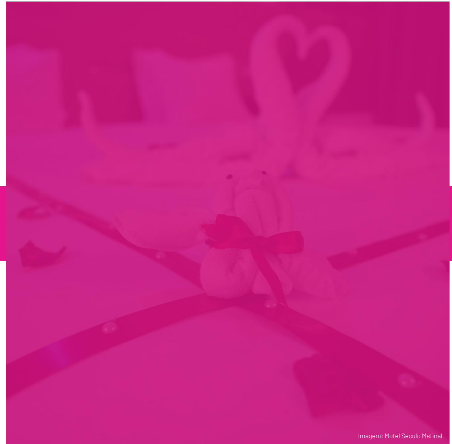
Imagem: Motel Século Matinal

Alguns Motéis podem começar a oferecer programas educacionais sobre sexualidade e relacionamentos para ajudar as pessoas a navegar de forma saudável e consensual nas suas vidas sexuais.