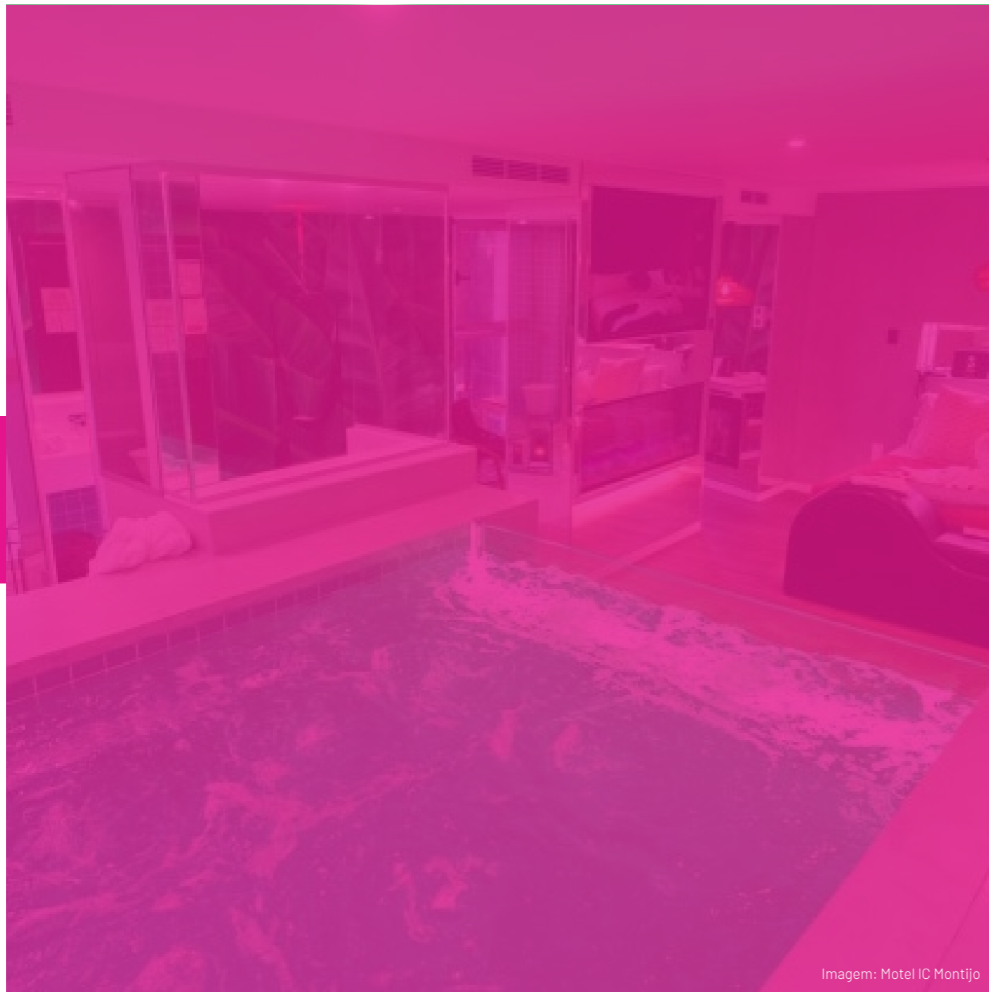
Imagem: Motel IC Montijo

A relação entre Motéis e relacionamentos pode ser complexa.